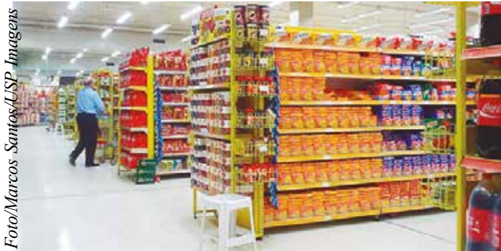
Os processamentos de destaque do Estado são a fabricação e refino de açúcar e o abate e fabricação de produtos à base de carne

Além disso, o número de postos de trabalho gerados chegou