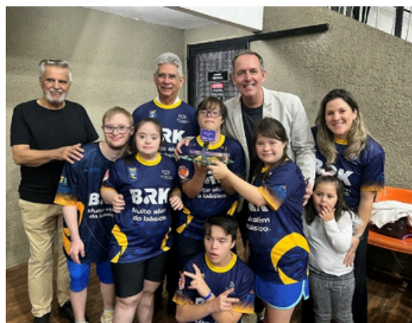
NOITE DE ENTREGA DO PRÊMIO LBF SOCIAL