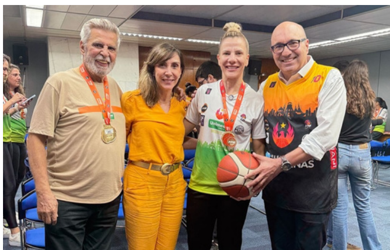
VISITA DA EQUIPE À PREFEITURA DE CAMPINAS