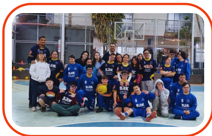
UPDOWN - S21 CAMPINAS ESPORTE E INCLUSÃO