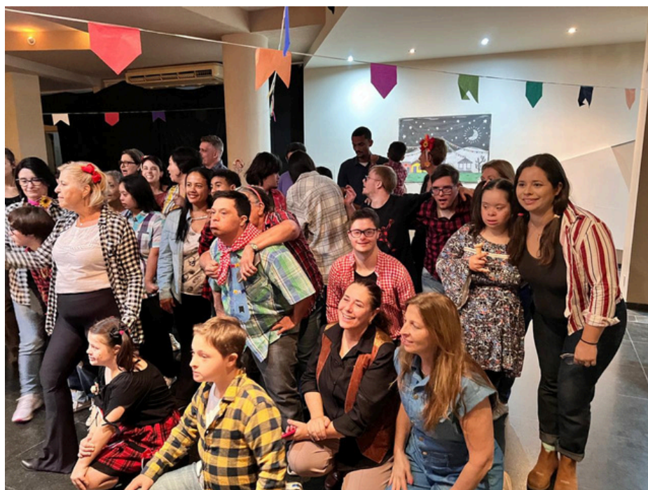
A FESTA JUNINA 2024, MARCOU UM MOMENTO DE CELEBRAÇÃO ENTRE ALUNOS, PAIS E PROFESSORES.