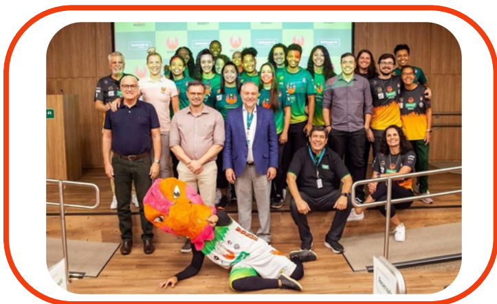
EQUIPE ADULTA FEMININA 2024 - UNIMED CAMPINAS BASQUETE