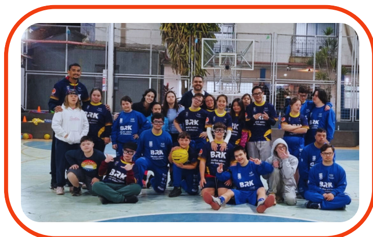
UPDOWN - S21 CAMPINAS ESPORTE E INCLUSÃO